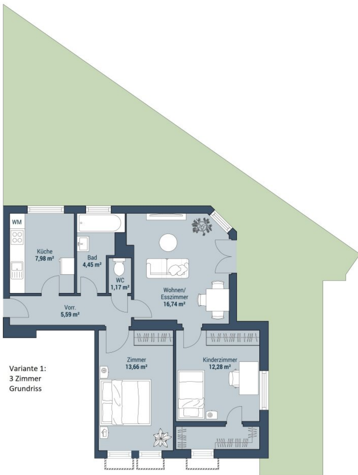
Variante 1: 3 Zimmer Grundriss