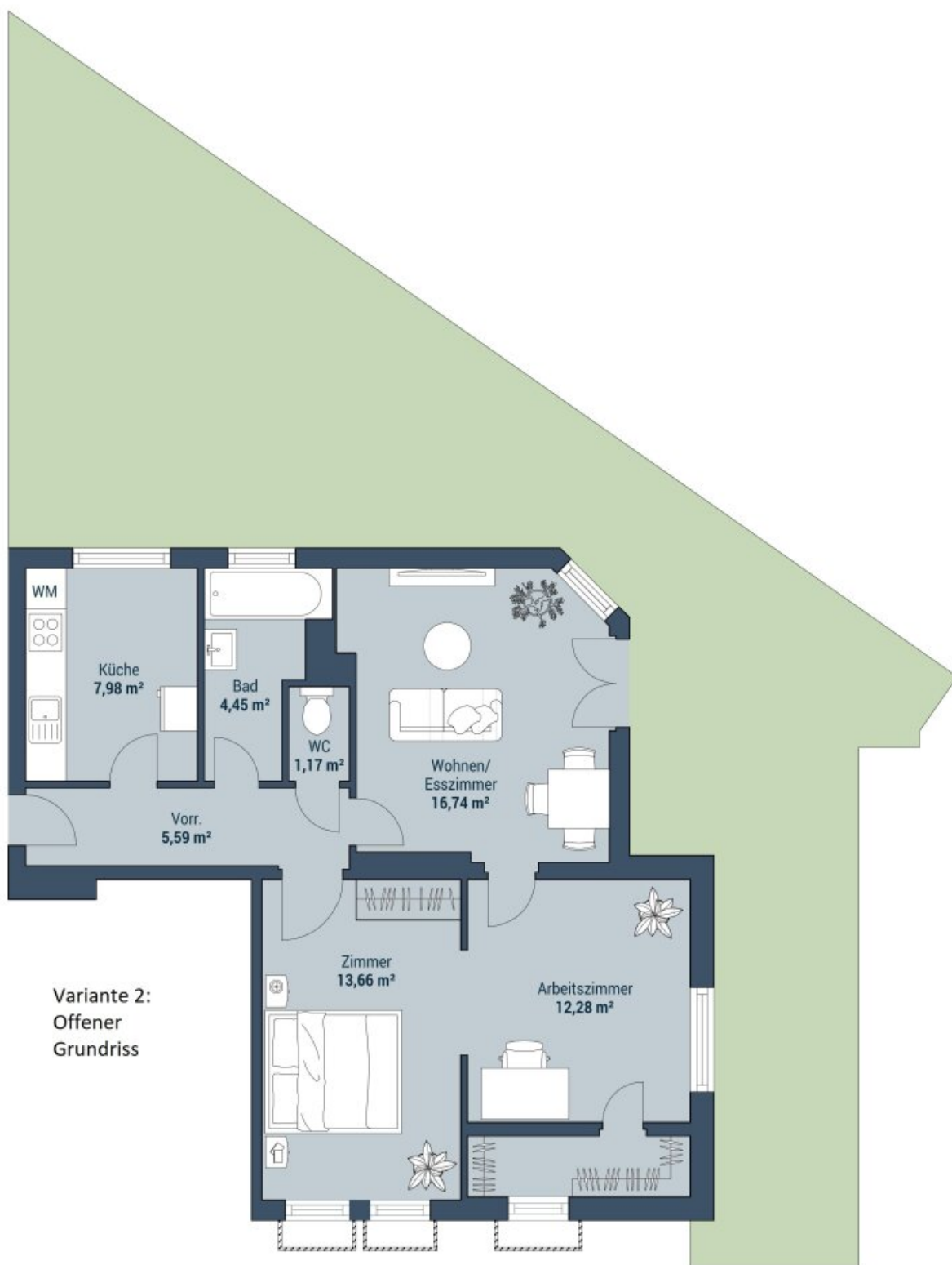
Variante 2: Offener Grundriss