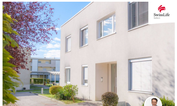
Gut ausgestattete und ruhige Familienwohnung in Söding nahe Graz | mit Süd-Westbalkon und Carport