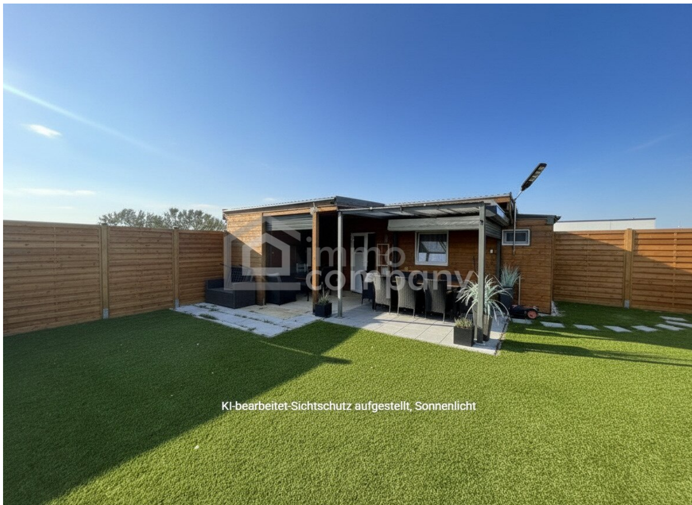
KI-bearbeitet-Sichtschutz aufgestellt, Sonnenlicht