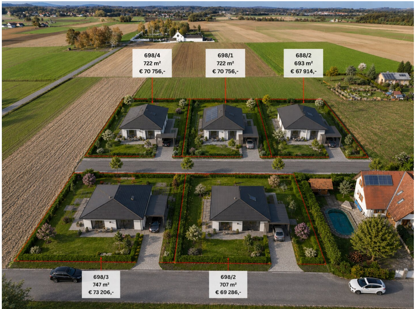
Grundstück - Rendering