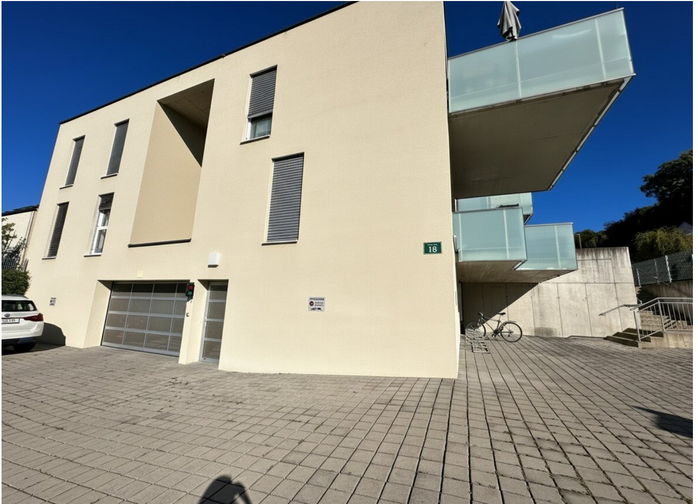
Vorderansicht - Gebäude - Tiefgarage