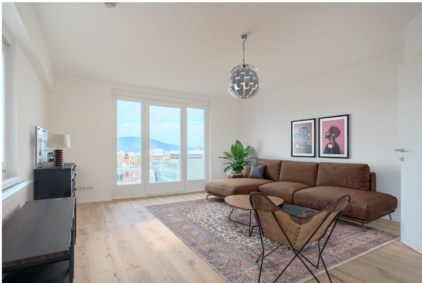
Zimmer 1 (Wohnzimmer) Einrichtungsbeispiel