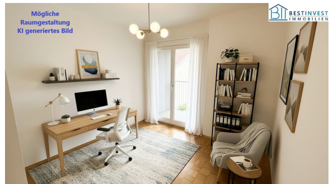
Mögliche Raumgestaltung KI generiertes Bild