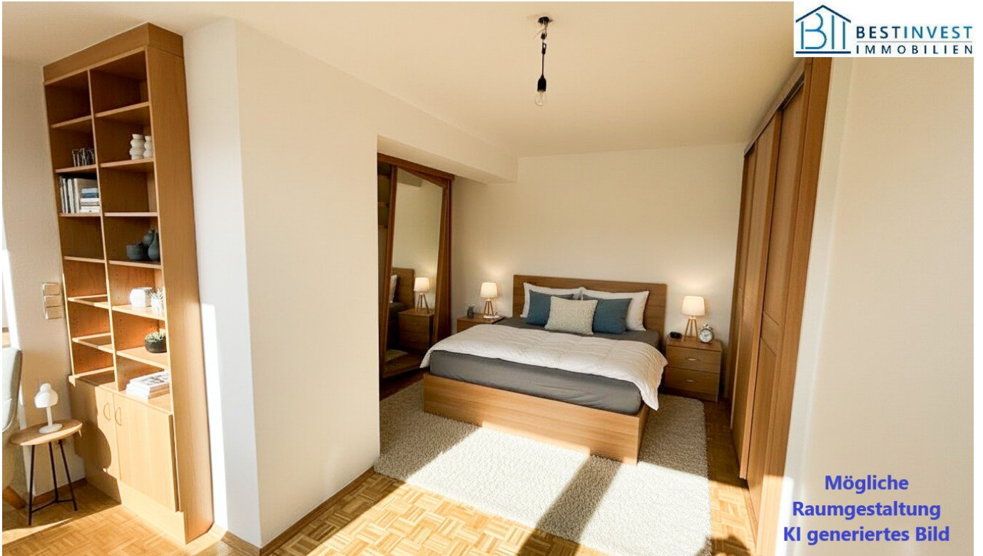
Mögliche Raumgestaltung KI generiertes Bild