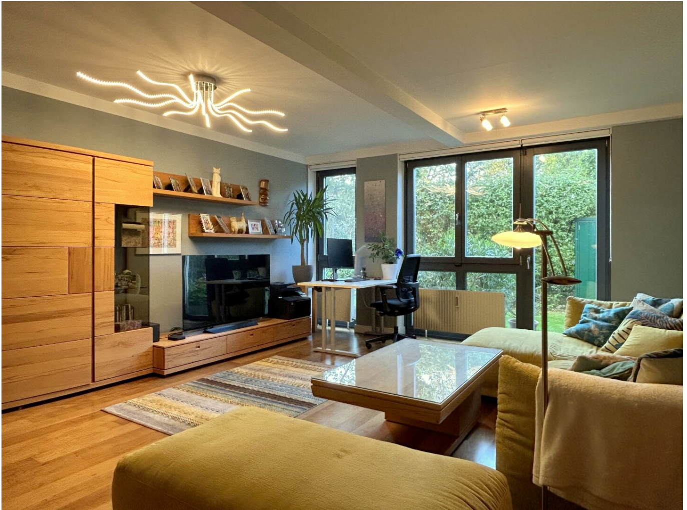
Wohnzimmer mit Gartenzugang