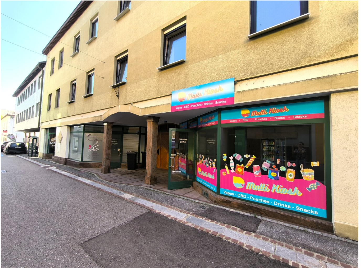
Geschäftslokal - TOP 1