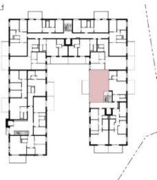
ÜBERSICHT (ohne Maßstab)