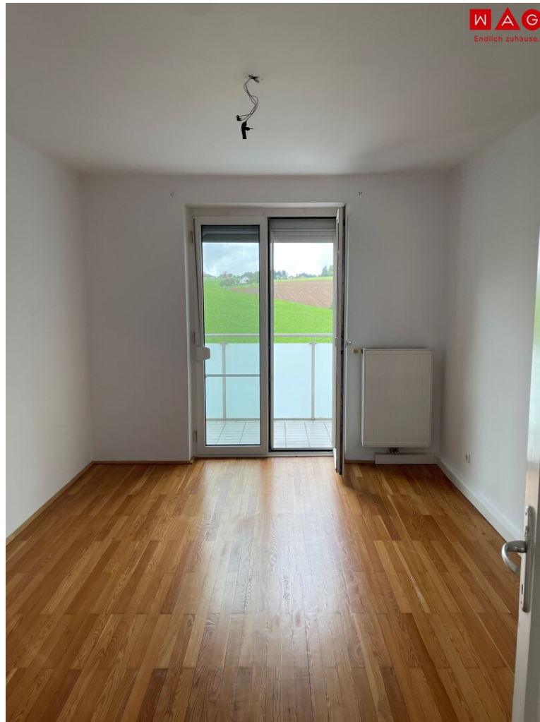
Wohnzimmer mit Balkonzugang