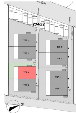
ÜBERSICHT | LAGE