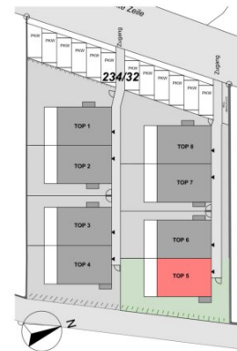
ÜBERSICHT | LAGE