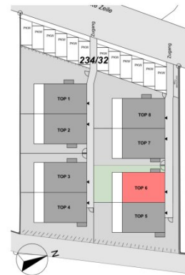
ÜBERSICHT | LAGE