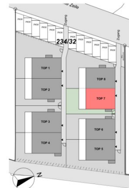
ÜBERSICHT | LAGE