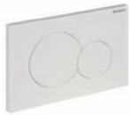
Betätigungsplatte für 2-Mengen Spülung, Betätigung von vorne, Kunststoff weiß