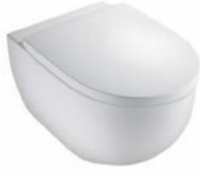
Wand Tiefspül WC mit WC-Sitz