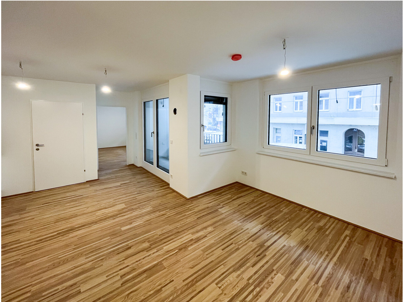
Wohnküche perspektive 2

Objektnummer: 109255982_17 Eine Immobilie von ÖRAG Immobilien