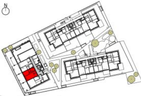
Übersicht Erdgeschoss M=1 : 1250