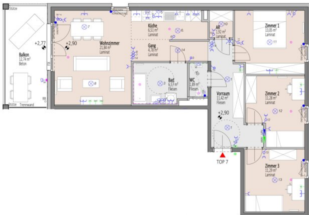
Übersicht 1.Obergeschoss M=1 : 1250