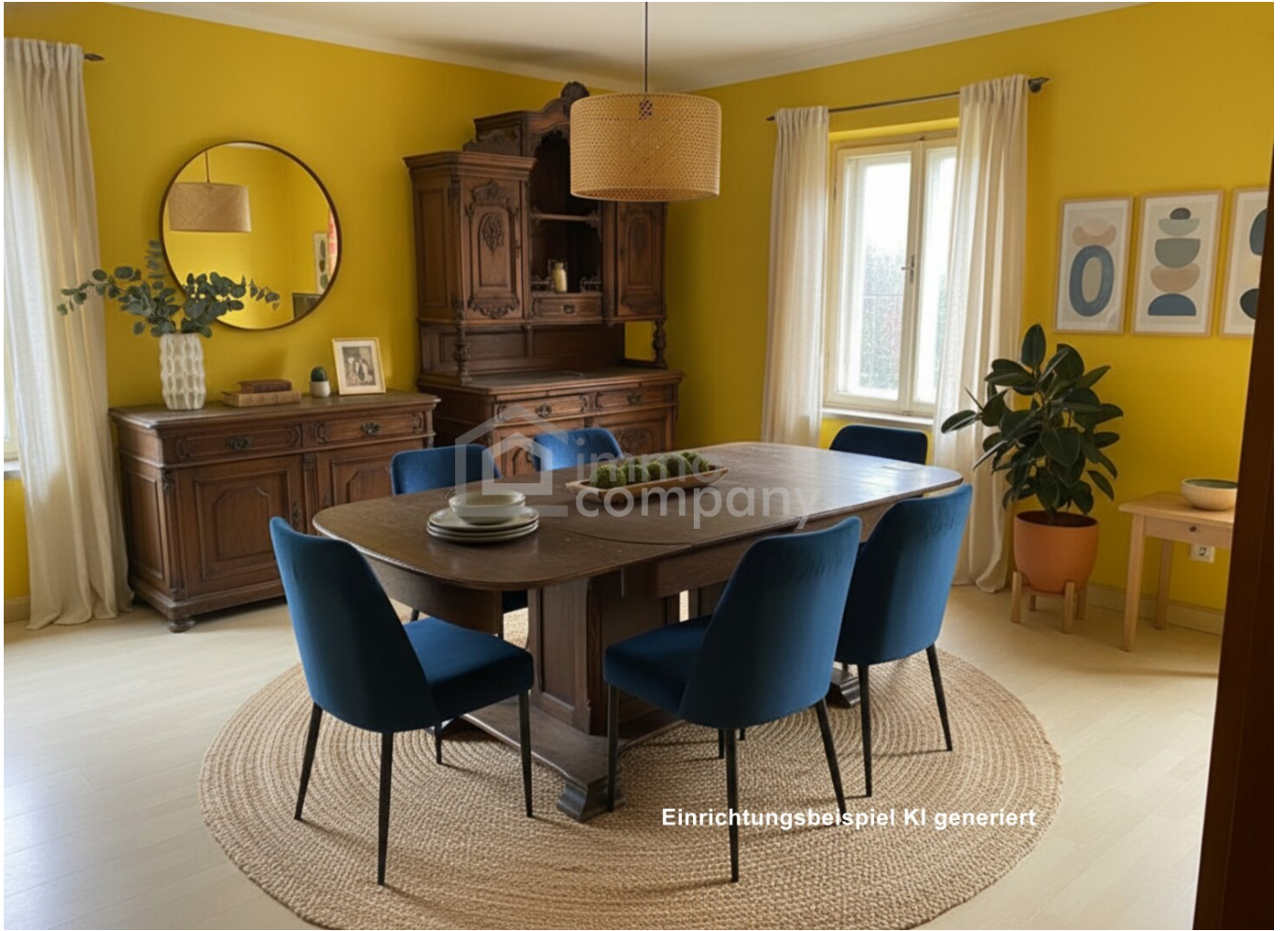
Einrichtungsbeispiel KI generiert