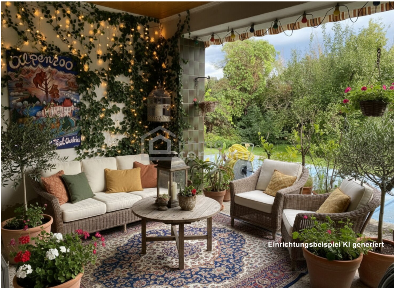
Einrichtungsbeispiel KI generiert