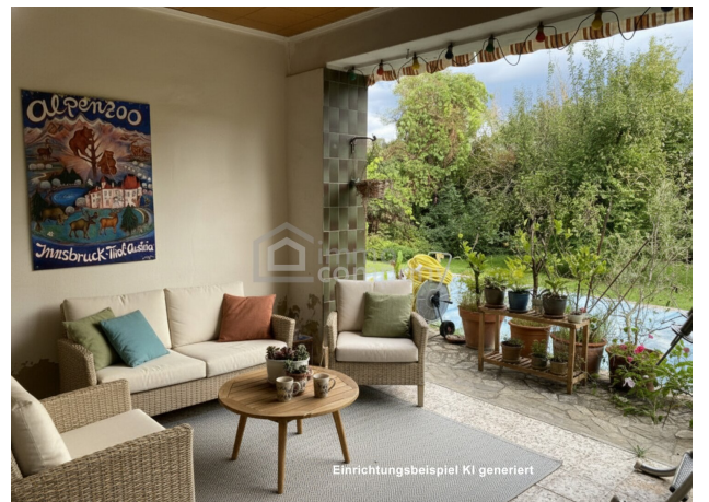
Einrichtungsbeispiel KI generiert