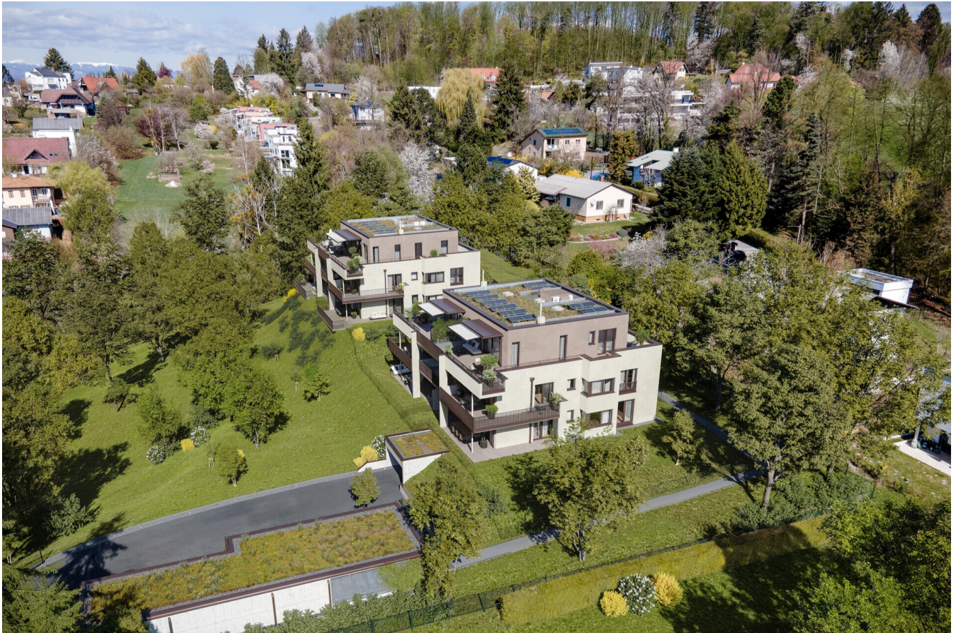
Luftschloss View 2

Objektnummer: 109251174_3 Eine Immobilie von ÖRAG Immobilien