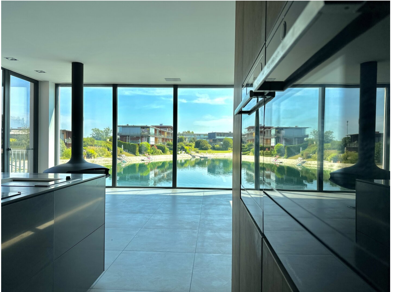
Fokus - Küchenfoto