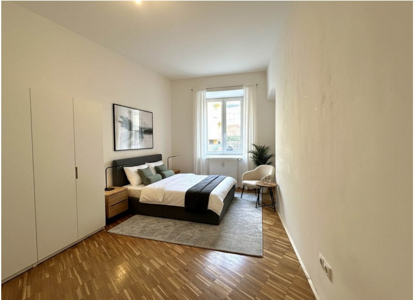
Schlafzimmer - mögliche Einrichtung