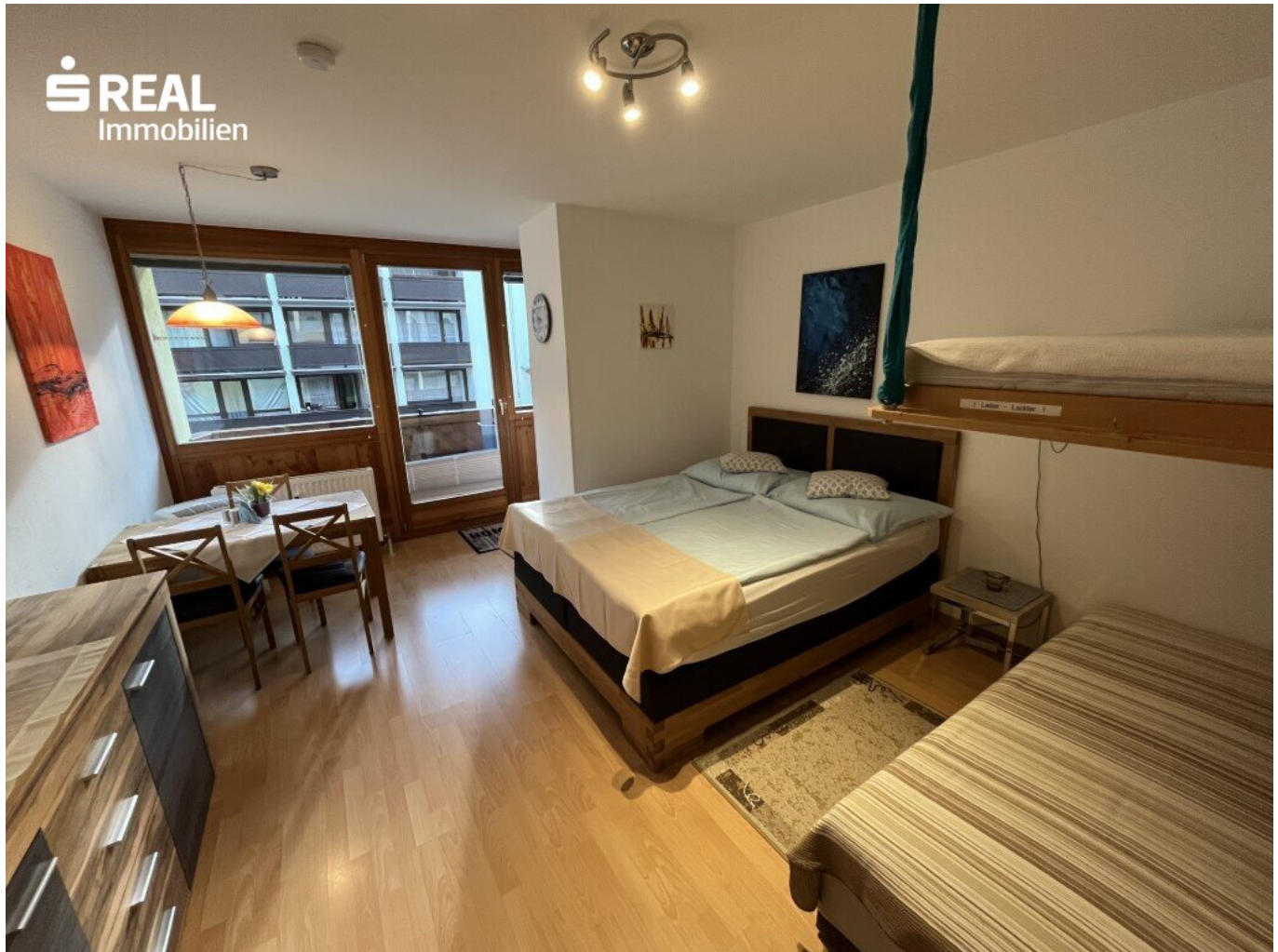
Wohn-/Schlafbereich Wohnung 2