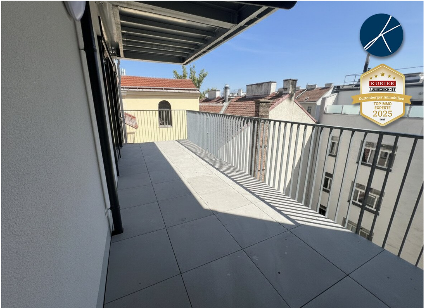
Innenhofbalkon 17,5 m²