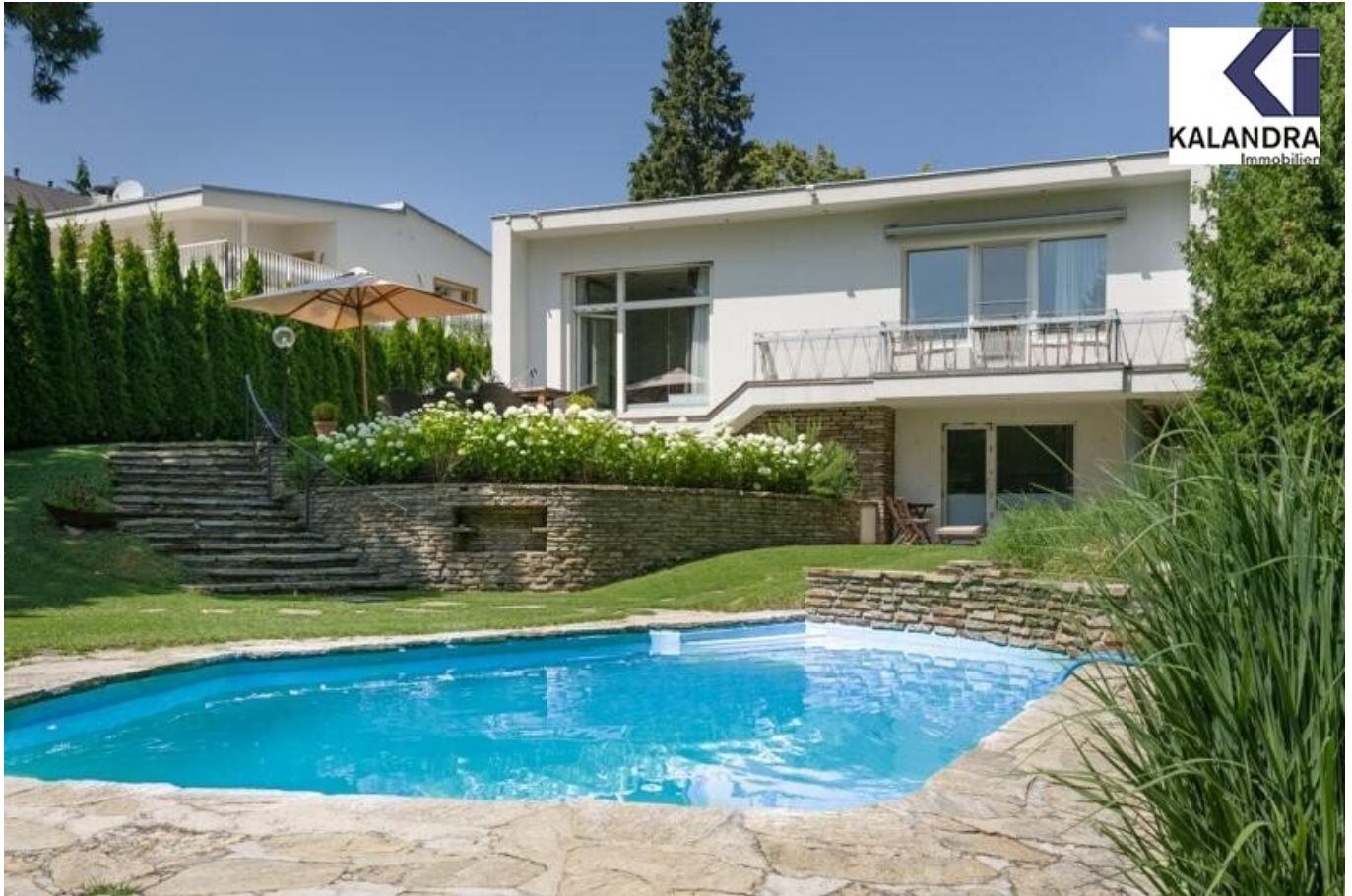
Hausansicht & Pool