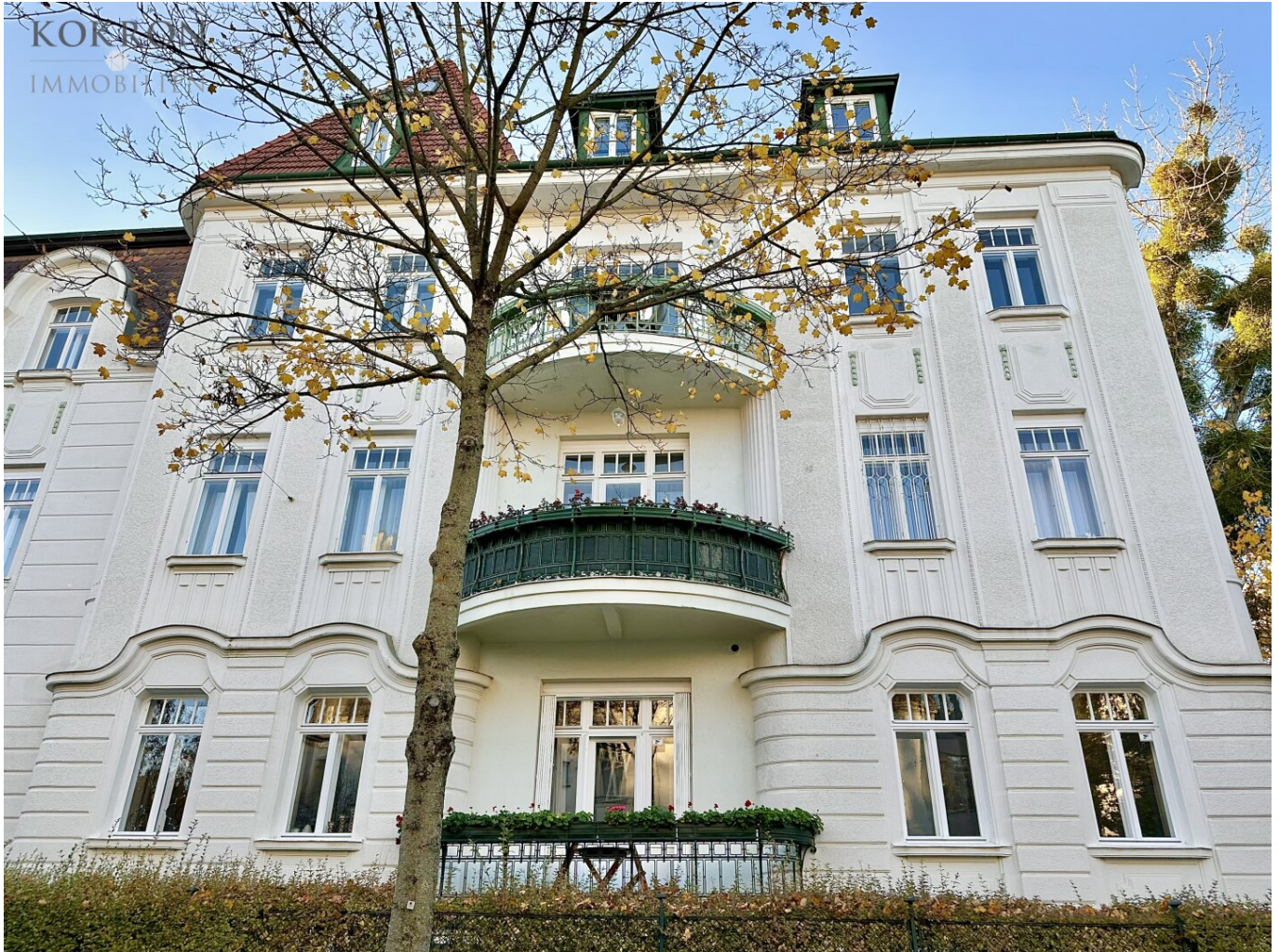
Die repräsentative Althietzinger Villa

Lieben Sie Wiener Altbau und das Hietzinger Villenviertel?