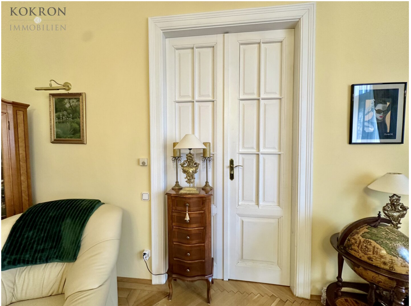
Die typischen Flügeltüren