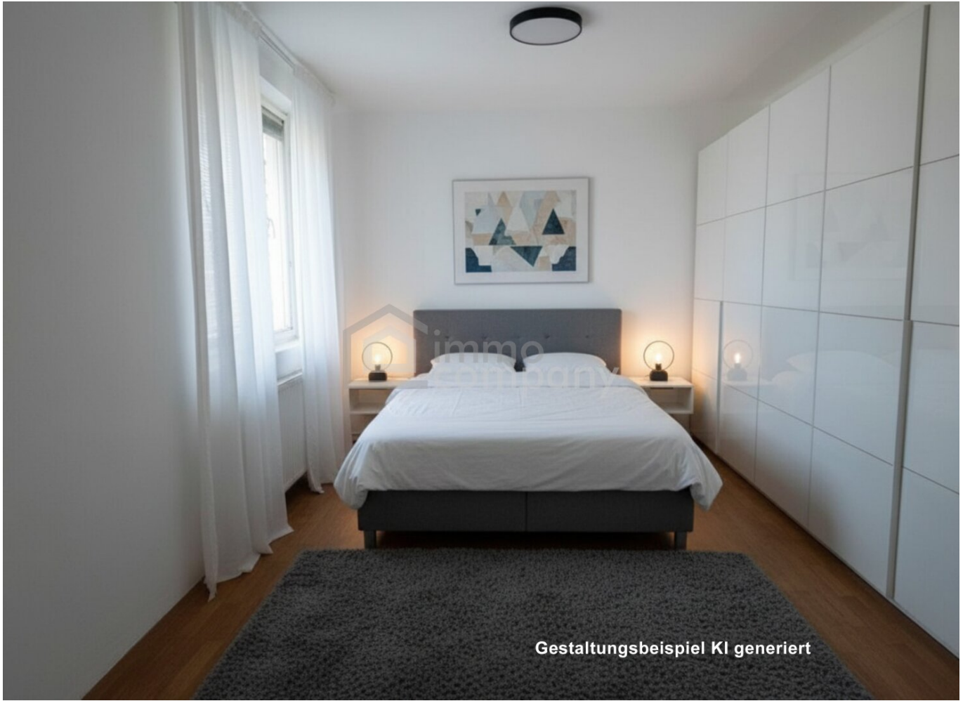
Gestaltungsbeispiel KI generiert