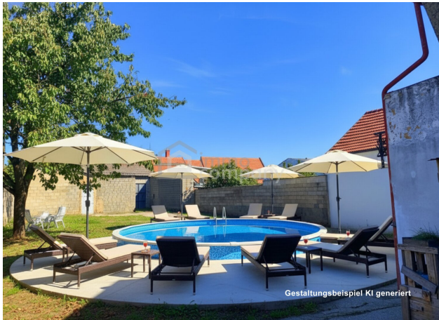
Gestaltungsbeispiel KI generiert