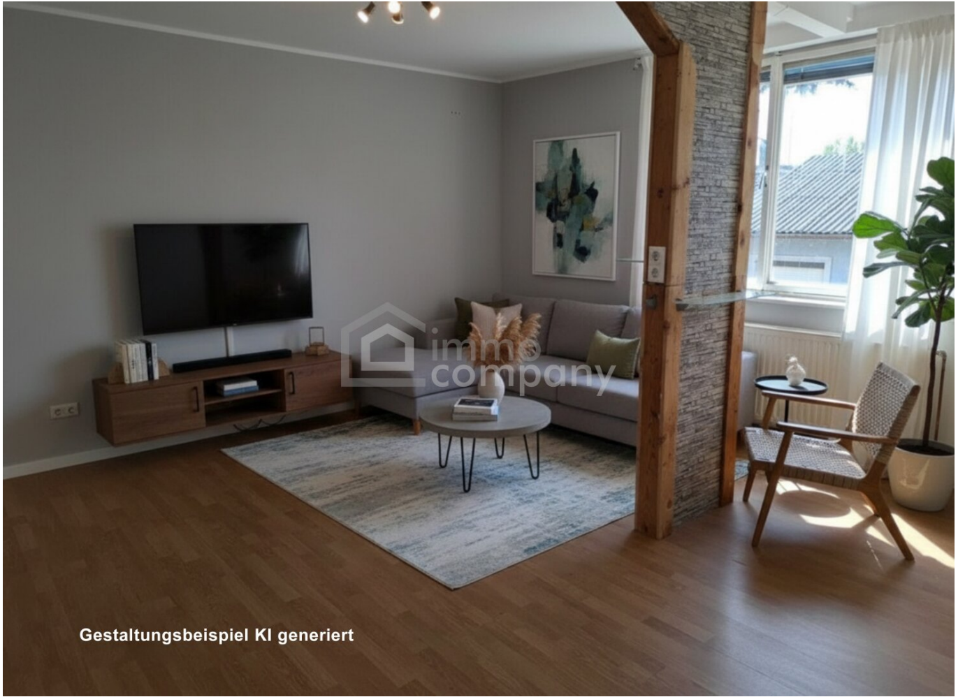
Gestaltungsbeispiel KI generiert