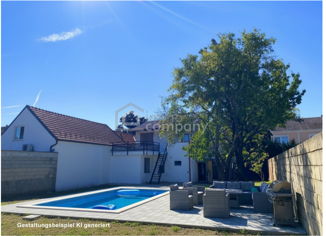
Gestaltungsbeispiel KI generiert