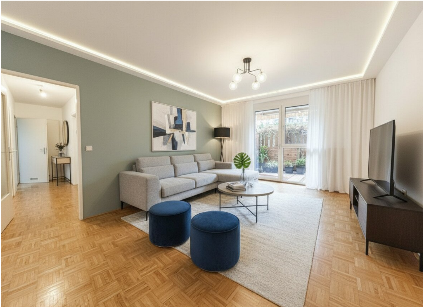
Wohnbereich - mögliche Einrichtung

Ihr WOHLFÜHL ZUHAUSE !!! TOP Wohnung in optimaler Lage *** mit TIEFGARAGENSTELLPLATZ ***