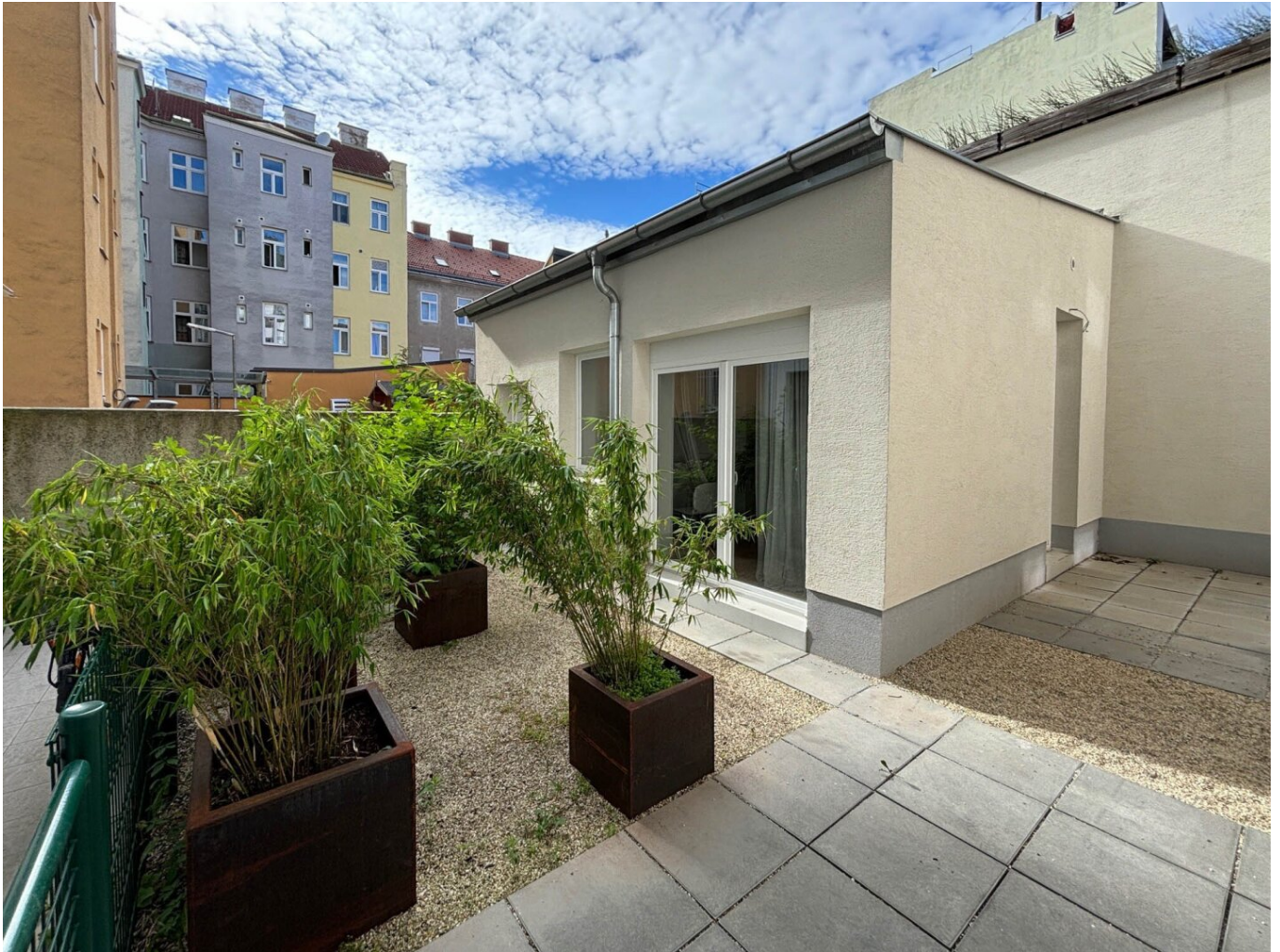
Vorplatz / Terrasse