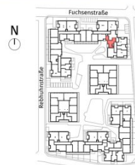
Lageplan ohne Maßstab