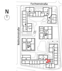
Lageplan ohne Maßstab