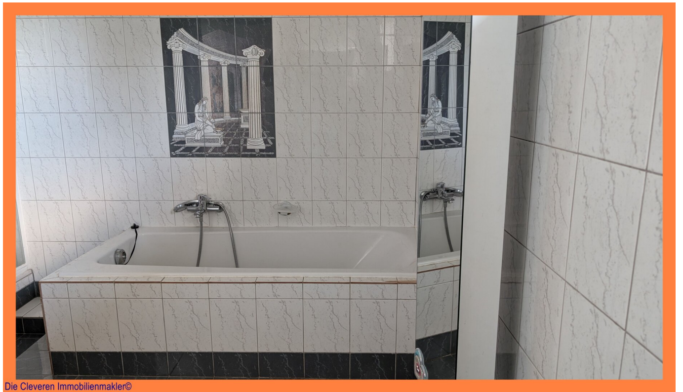
Die Cleveren Immobilienmakler©