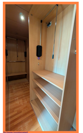
Die Cleveren Immobilienmakler©