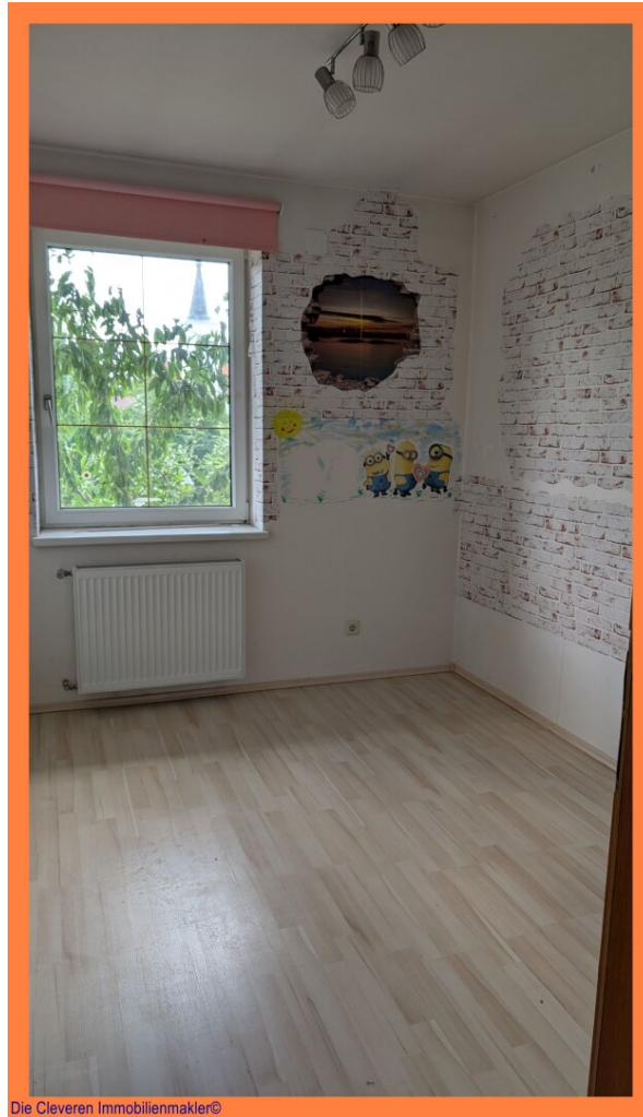
Die Cleveren Immobilienmakler©