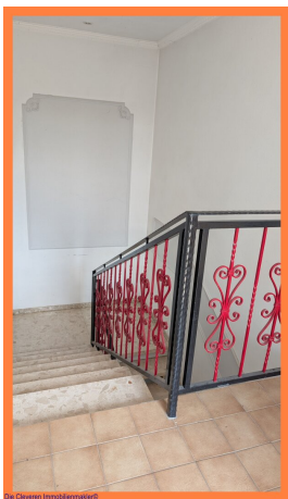
Die Cleveren Immobilienmakler©