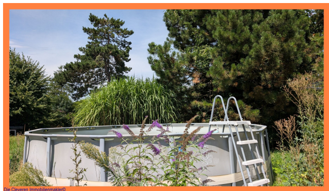
Die Cleveren Immobilienmakler©