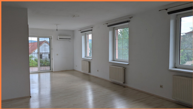
Die Cleveren Immobilienmakler©