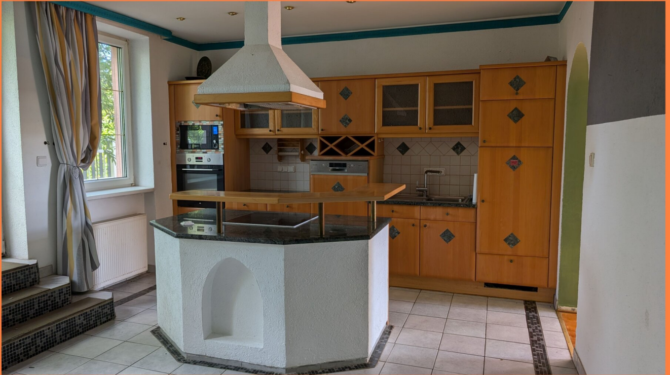
Die Cleveren Immobilienmakler©