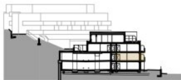
SCHNITT BK 01