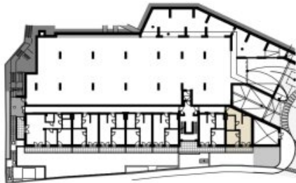
GRUNDRISS BK 01