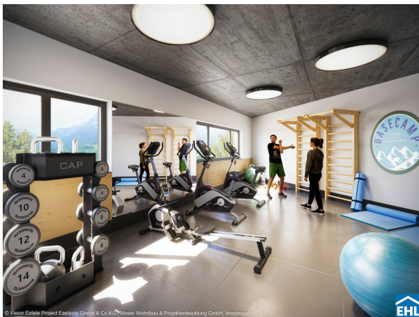
© Vision Estate Project Eastside GmbH & Co KG | Moser Wohnbau & Projektentwicklung GmbH, Innsbruck