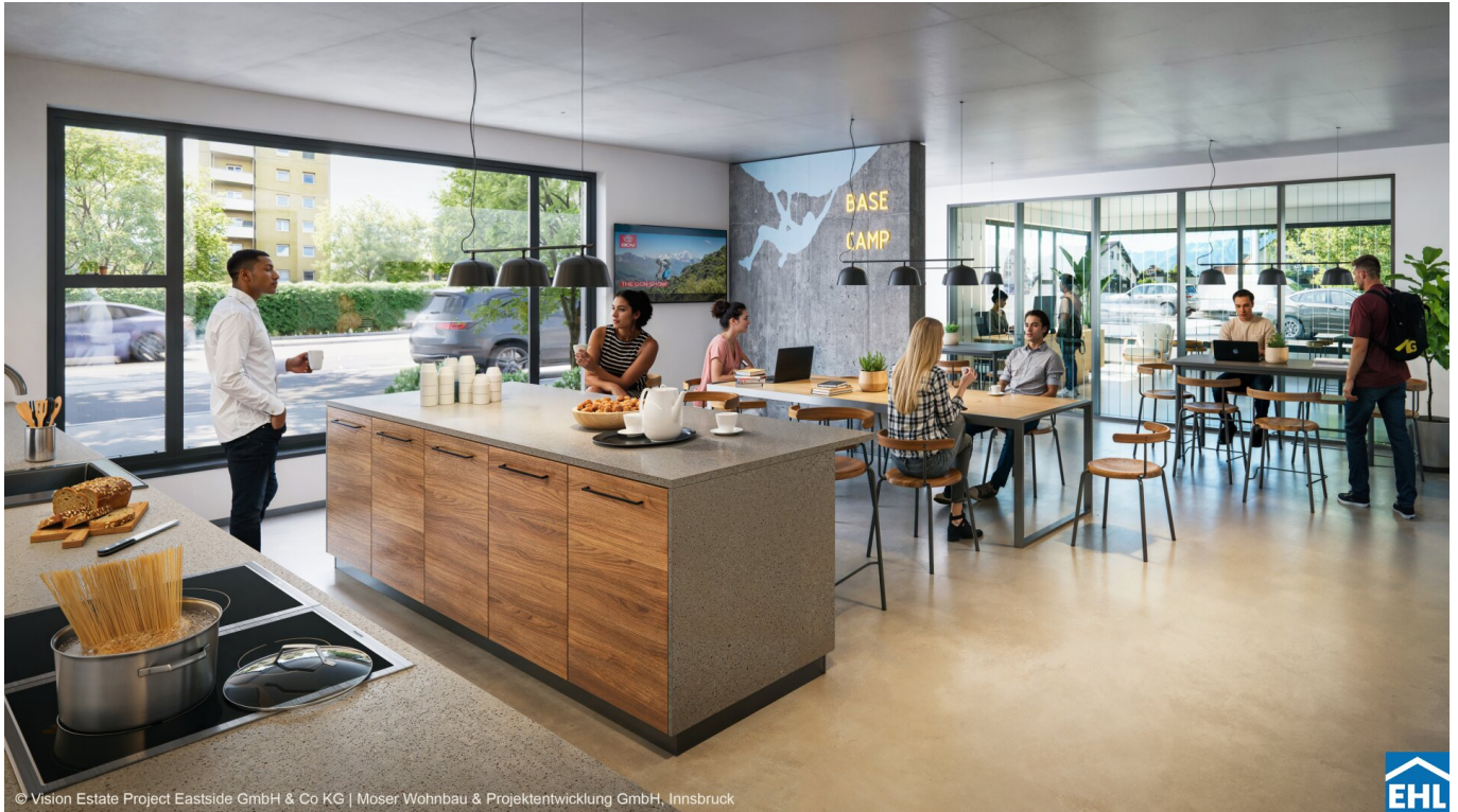
© Vision Estate Project Eastside GmbH & Co KG | Moser Wohnbau & Projektentwicklung GmbH, Innsbruck