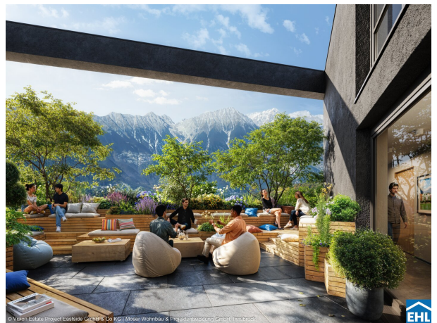
© Vision Estate Project Eastside GmbH & Co KG | Moser Wohnbau & Projektentwicklung GmbH, Innsbruck