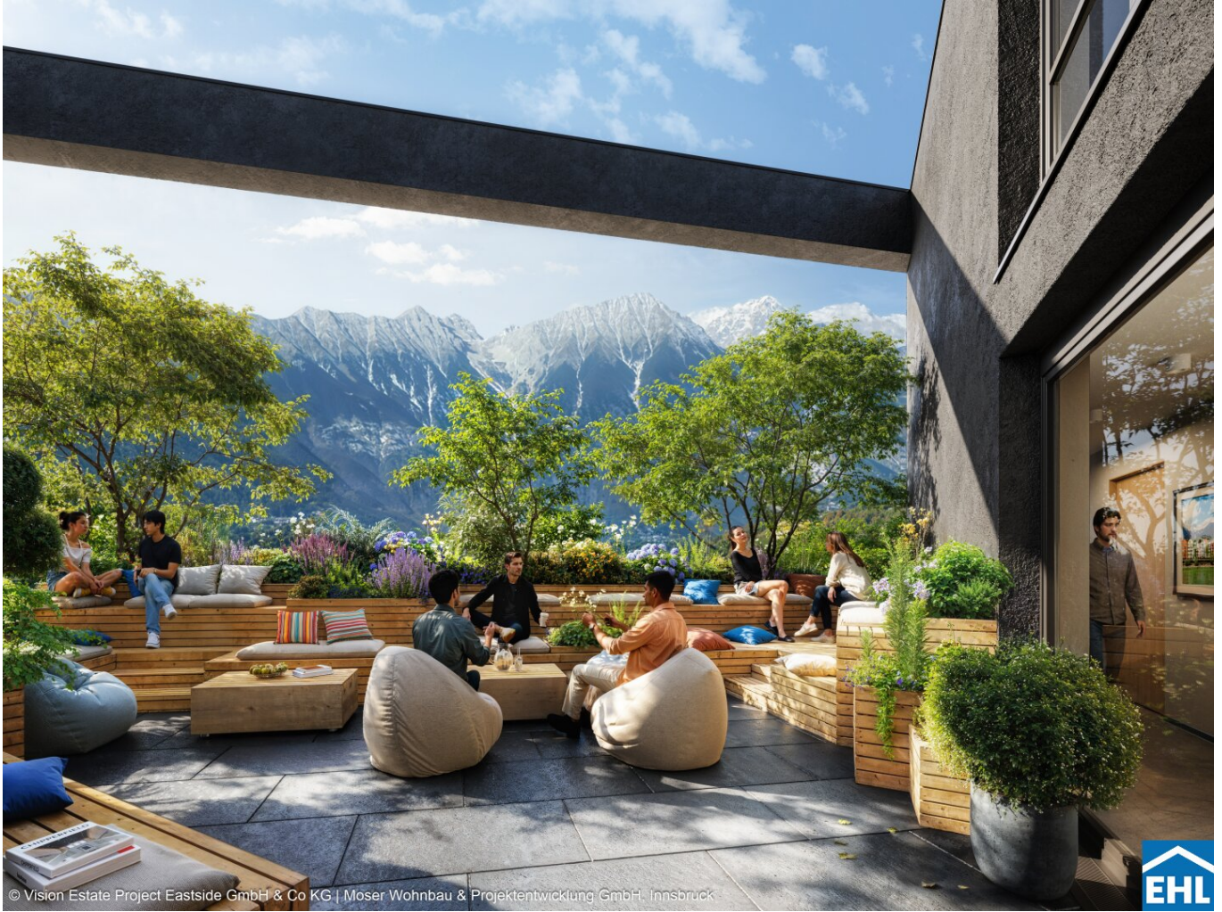
© Vision Estate Project Eastside GmbH & Co KG | Moser Wohnbau & Projektentwicklung GmbH, Innsbruck