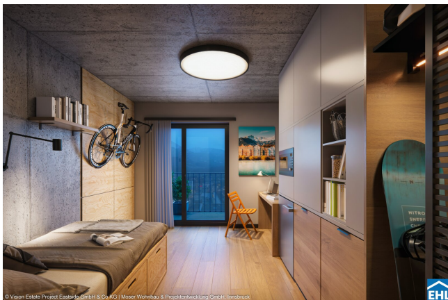
© Vision Estate Project Eastside GmbH & Co KG | Moser Wohnbau & Projektentwicklung GmbH, Innsbruck