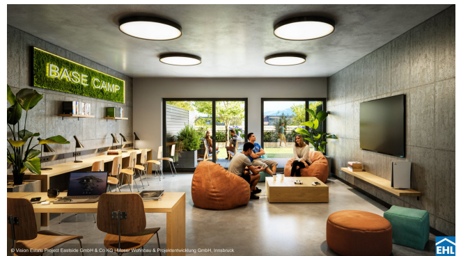
© Vision Estate Project Eastside GmbH & Co KG | Moser Wohnbau & Projektentwicklung GmbH, Innsbruck