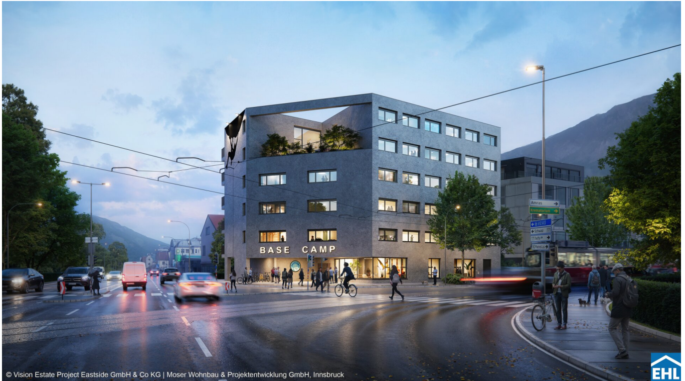
© Vision Estate Project Eastside GmbH & Co KG | Moser Wohnbau & Projektentwicklung GmbH, Innsbruck