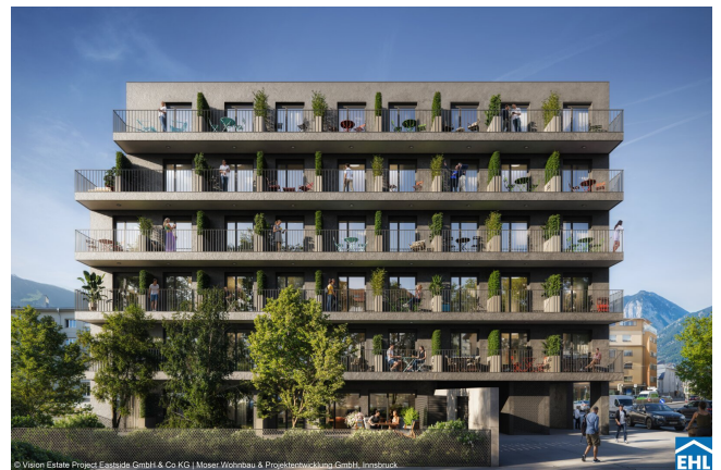
© Vision Estate Project Eastside GmbH & Co KG | Moser Wohnbau & Projektentwicklung GmbH, Innsbruck