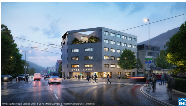
© Vision Estate Project Eastside GmbH & Co KG | Moser Wohnbau & Projektentwicklung GmbH, Innsbruck