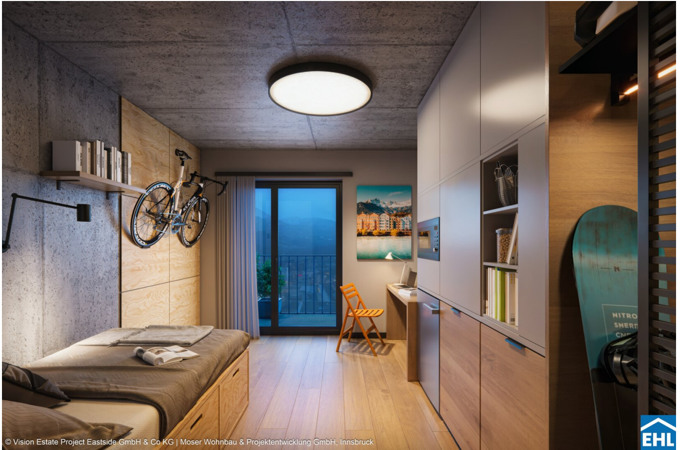
© Vision Estate Project Eastside GmbH & Co KG | Moser Wohnbau & Projektentwicklung GmbH, Innsbruck