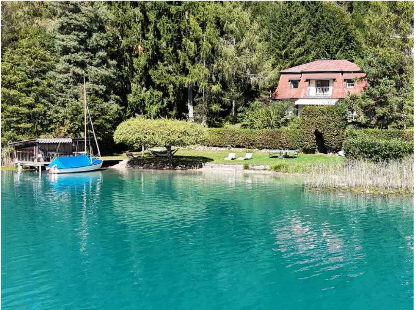
Seehaus a Faaker See

Objektnummer: 905/03522 Eine Immobilie von ATV Immobilien