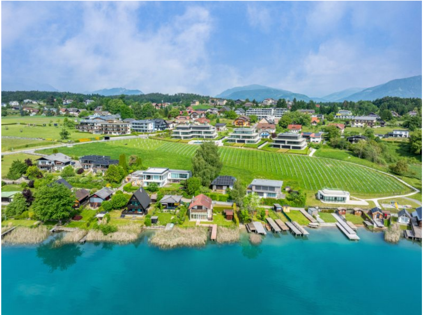
Ansicht Cloud P

Objektnummer: 905/03519 Eine Immobilie von ATV Immobilien