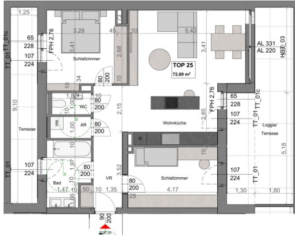
VERKAUFSPLAN TOP 25 1:75