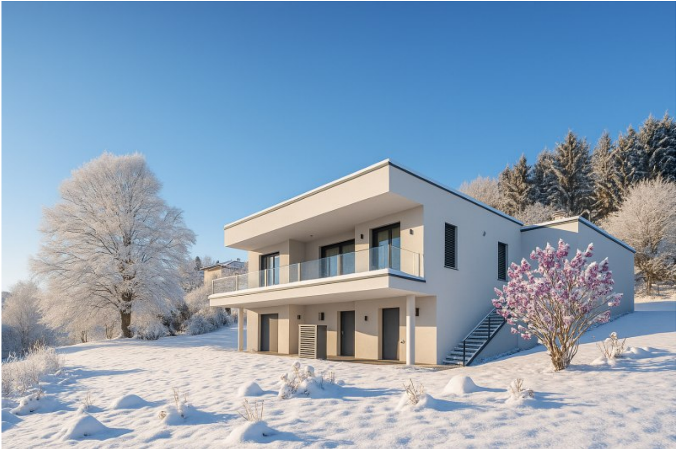
Villa Ossiach Winter