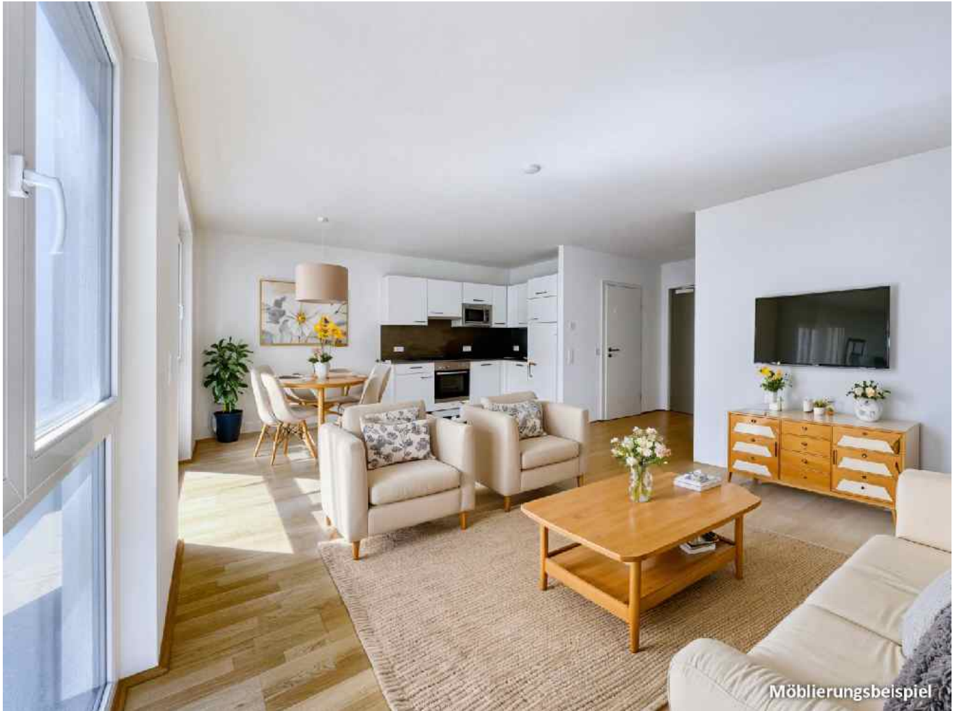
Küche & Wohnbereich

Objektnummer: 141/83603 Eine Immobilie von Rustler