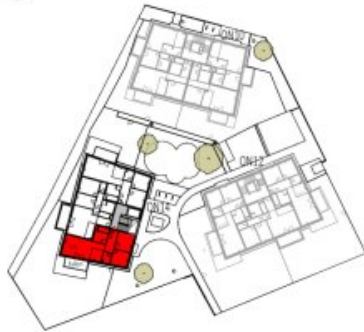
Übersicht 1. Obergeschoss M=1 : 1250