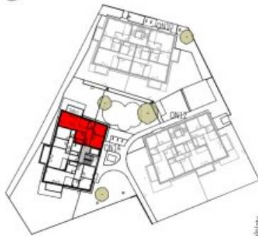
Übersicht 1. Obergeschoss M=1 : 1250