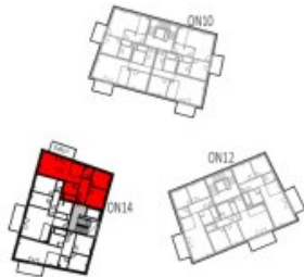
Übersicht 2. Obergeschoss M=1 : 1250