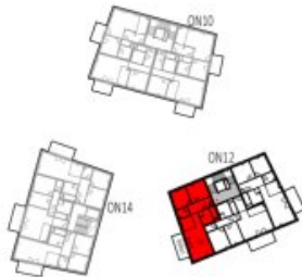
Übersicht 2. Obergeschoss M=1 : 1250