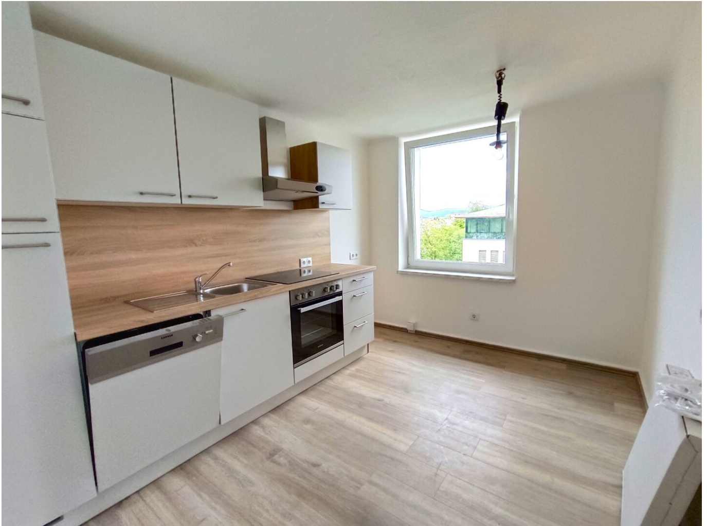
Küche - Wohnung - Klagenfurt - Kaufen