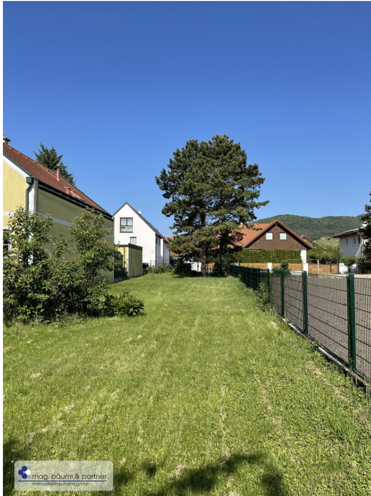
Grundstück (Blick nach West)